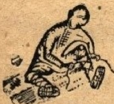
Рис. художника НОСОВА